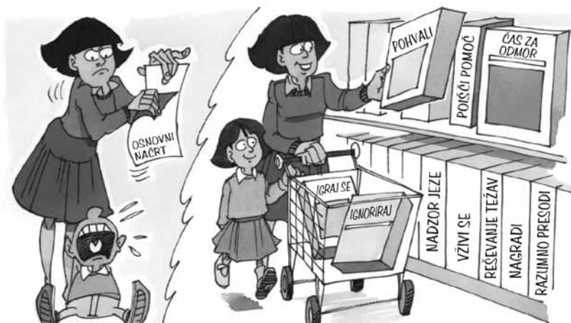
Spodbujanje starševskih strategij reševanja težav in učinkovitega spoprijemanja z njimi

Knjiga Neverjetna leta temelji na raziskavi, izvedeni na Kliniki za vzgojo Univerze Washington. V zadnjih petindvajsetih letih smo sodelovali, preučevali in izvajali programe o vzgoji z več kot 3000 starši otrok z vedenjskimi težavami, starih od dva do osem let. Glavni namen te raziskave je zasnovati učinkovite programe ukrepanja za pomoč družinam, katerih otroci so hudo neobvladljivi. Preučevali smo otroke z razmeroma nepomembnimi težavami, kot so jokanje in izbruhi jeze, in otroke z resnejšimi težavami, kot so laganje in kraje. Delali smo z najrazličnejšimi družinami: dvostarševskimi, enostarševskimi,